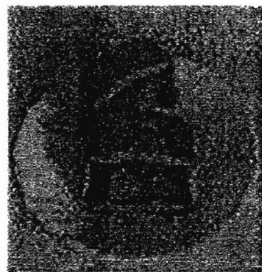
歌舞表演 提灯笼游行

欲知详情，请拨电：9876XXXX 或者请上网： www.dazhong.e-c.sg 或者电邮至： mid-autumn@dahong.e-c.sg