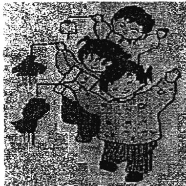
有趣游戏 品尝月饼