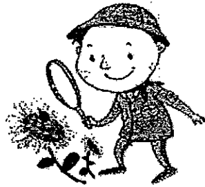
野外活动， 认识自然界的生物