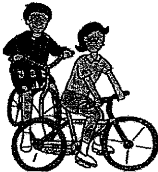
骑车环岛行， 欣赏美丽的风景