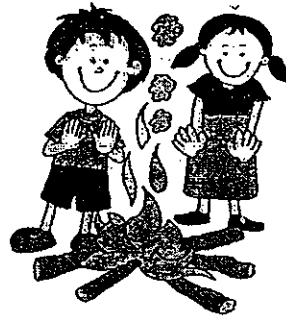
充满欢乐的营火会